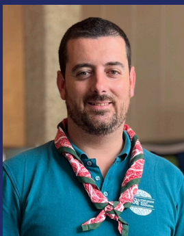
José Pamplona Comunicación y Colaboraciones